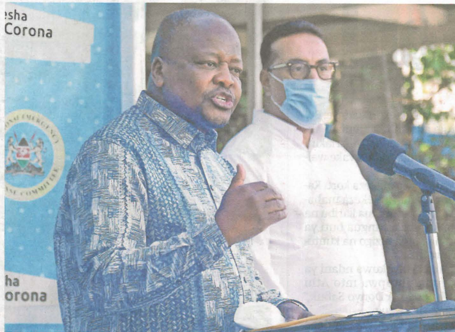
Waziri wa Afya katika mojawapo ya vikao vya kutoa taarifa za punde kuhusu hali ya corona nchini, katika jumba la Afya House mjini Nairobi. Hapa aliandamana na Waziri wa Utalii Najib Balala.